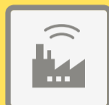
ГУДКИ ПРЕДПРИЯТИЙ И ТРАНСПОРТНЫХ СРЕДСТВ